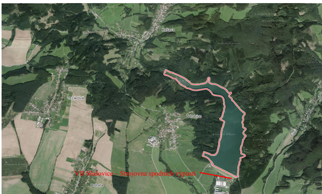
Letecký snímek s označením Strojovny spodních výpustí VD Slušovice